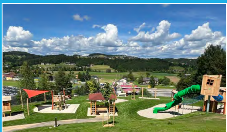
Kinderspielfeld im Freizeitzentrum