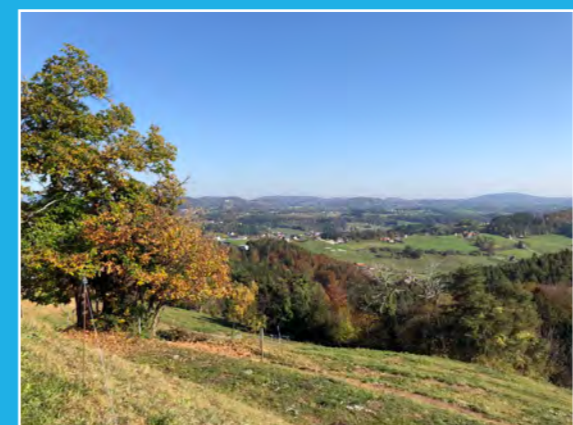
Aussicht am Raßberg