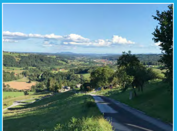
Stallhofen - Södingtalblick