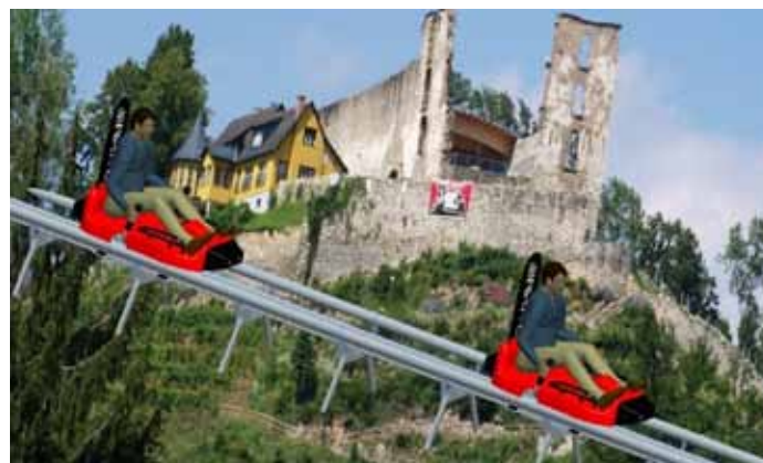
Burgruine Obervoitsberg mit Sommerrodelbahn

Erfolg kann auch ansteckend sein. Mehrere Schüler der 4VHMIF BULME-Voitsberg suchen sich eine besondere Herausforderung im Konstruktionsunterricht. Derzeit haben vier Projektgruppen Sonderaufgaben, bei welchen es einige noch unbekannte Nüsse zu knacken gibt. Aber wenn die Motivation groß ist so wird sich auch ein Lösungsweg finden. Entscheidend ist die Begeisterung und das Erlernte – es können nicht alle einen ersten Platz erringen.