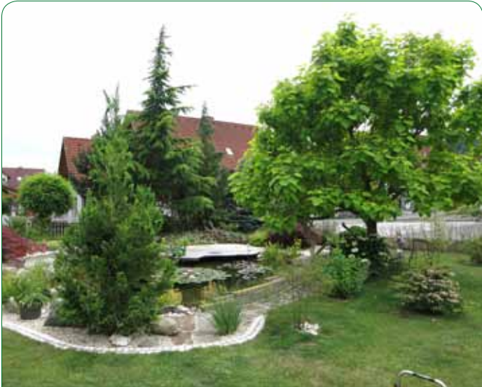
Dr. Hans Reiter