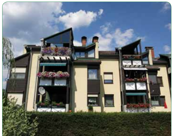
Wohnhaus „Stallhofen 260“